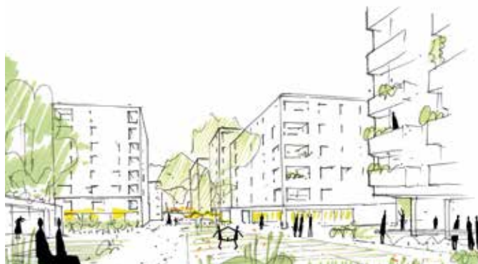
Entwurf: Astoc Architects and Planners / Glück Landschaftsarchitektur

Sprechstunde im Mieterbüro Mittwoch: 13:00–17:00 Uhr