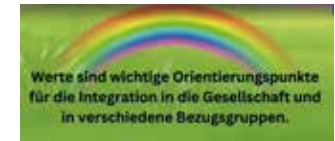
Ein Bild ist aus dem Erklärvideo zum Grundgesetz

tag, die Müllsammelaktion „der Hallschlag glänzt“ (s. Seite 19) und die anderen Termine des Wandernden Mittagstischs locken uns aus der Schule in den Stadtteil. Unsere Schule ist vielfältig und der Stadtteil ist bunt. ■