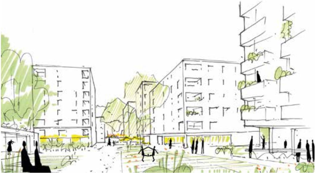
Daimlersiedlung Entwurf: Astoc Architects & Planners / Glück Landschaftsarchitektur

Ihre Stadtteilzeitung für den Hallschlag und Umgebung