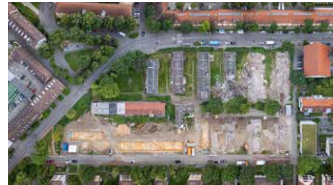
Teilgebiet 6: Rückbau

Der Rückbau der alten Gebäude ist nahezu abgeschlossen. Aktuell laufen archäologische Grabungen, die historische Funde aus der Römerzeit zutage fördern. Nach Abschluss der Arbeiten wird mit dem Bau des neuen Quartiers voraussichtlich im ersten Quartal 2025 begonnen. ■