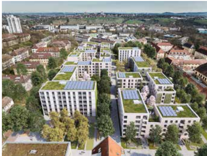
Teilgebiet 6: Visualisierung

Öffnungszeiten Bitte buchen Sie Ihren persönlichen Beratungstermin telefonisch oder online unter www.swsg.de